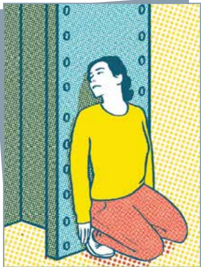
Se cacher derrière des obstacles solides