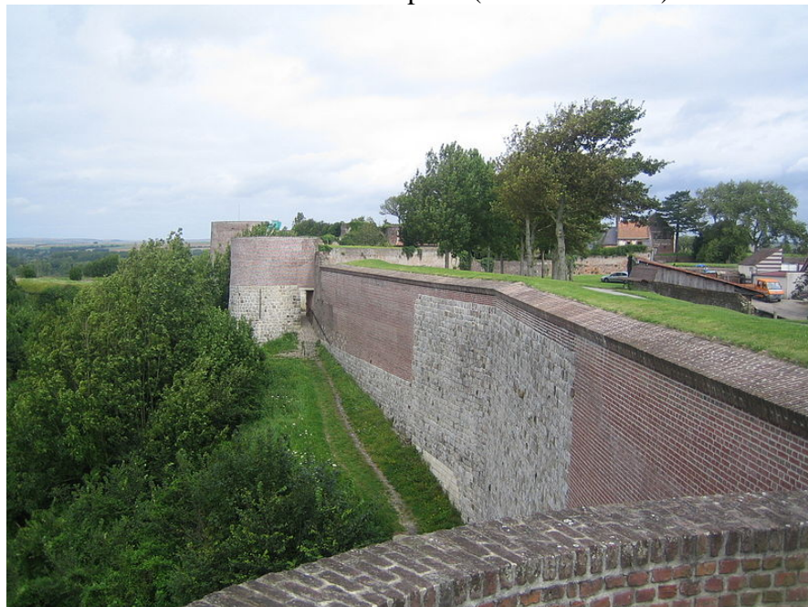
Une vue des remparts de Montreuil sur Mer

Au niveau patrimoine la région Montreuilloise est riche de : - sa citadelle et de ses remparts (édifices classés):