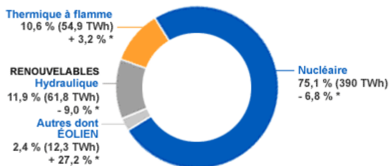
Part de l'éolien dans la production française d'électricité en 2009

L'éolien dans la production d'électricité française.