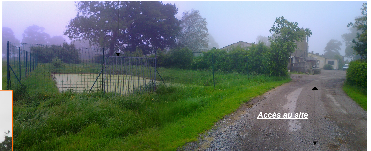
Accès au site