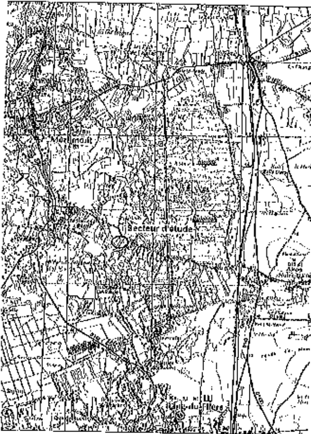
Localisation sur fond de carte IGN