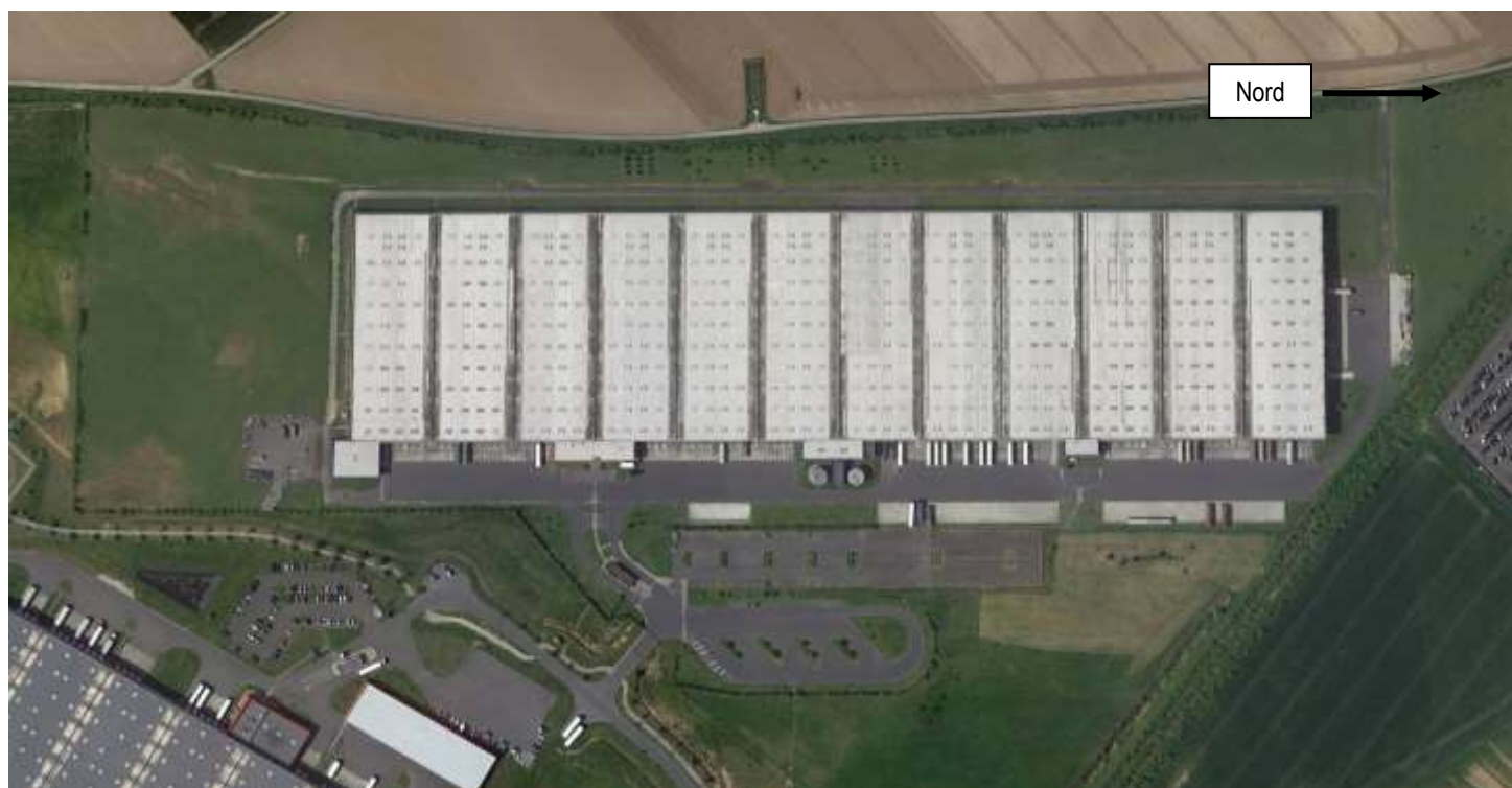
Visualisation du bâtiment existant

Le site est composé de 12 cellules de 6 000 m 2 visualisables sur la vue aérienne ci-dessous :