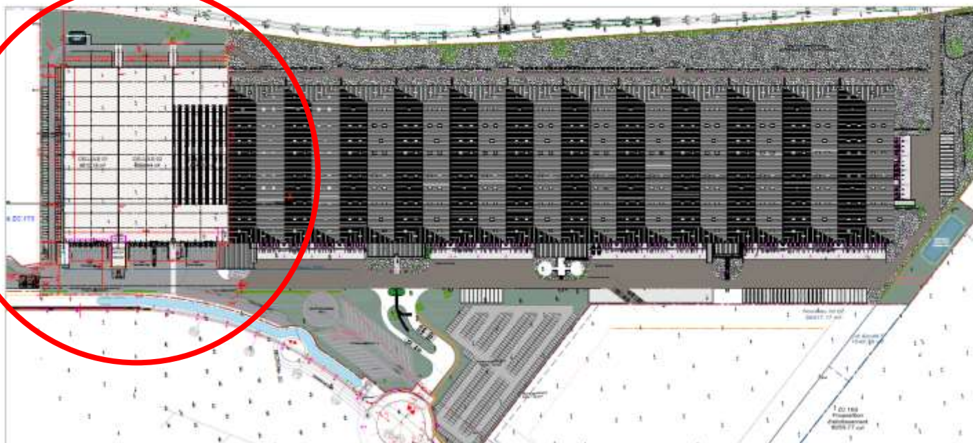
Visualisation du projet d'extension

Ces trois nouvelles cellules seront implantées dans le prolongement Sud du bâtiment existant comme visualisable sur le plan masse ci-dessous :