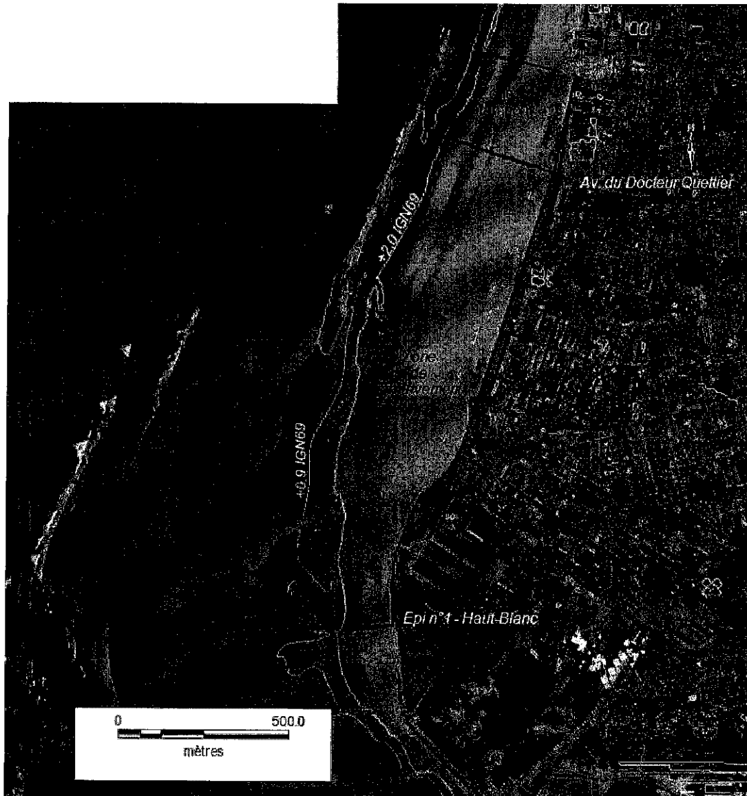
Localisation de la zone de prélèvement