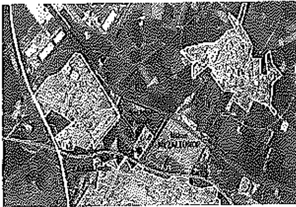
Plan de situation