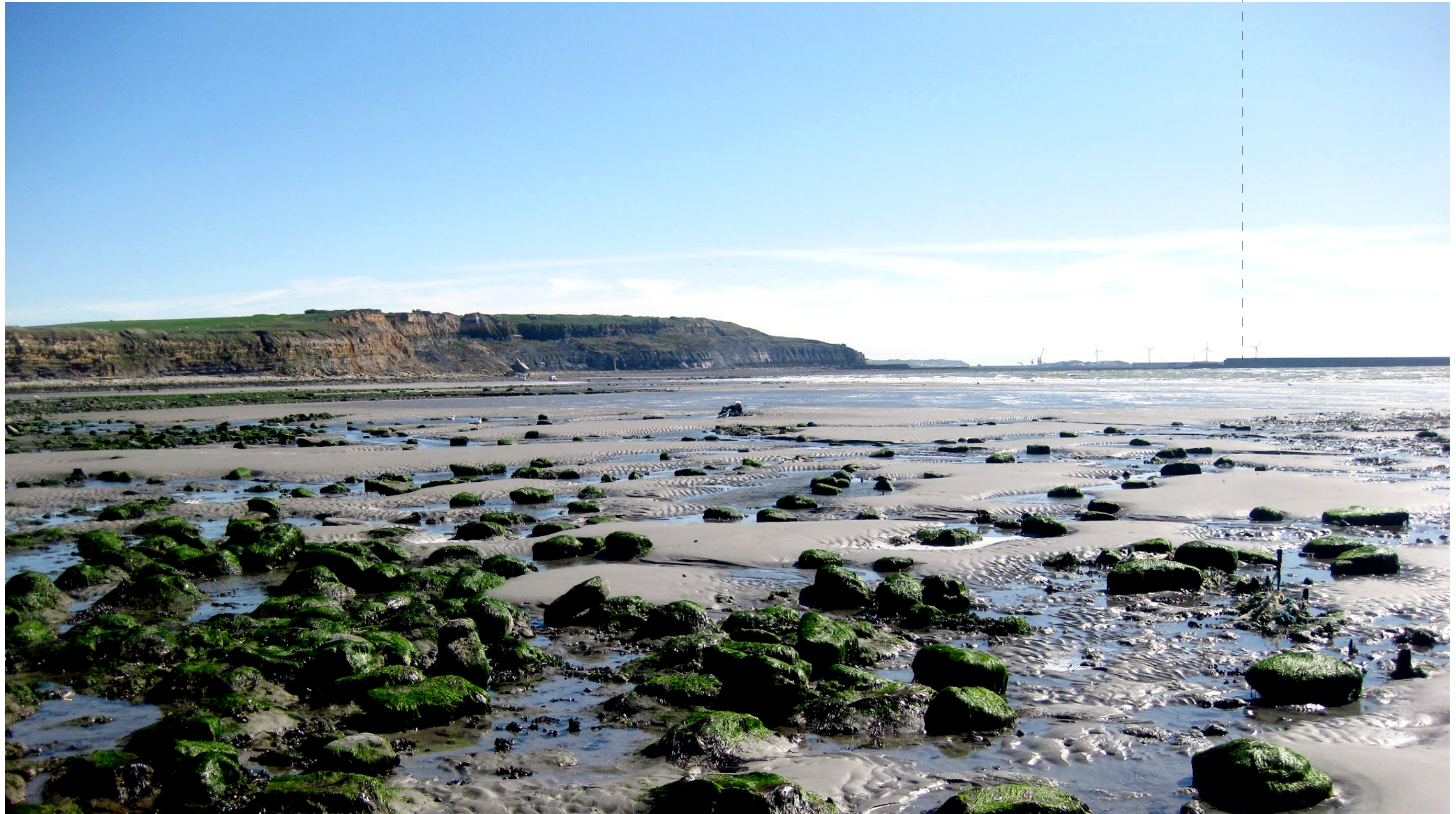
Vue depuis les ruines du Fort de Croÿ (situé à 5km du projet)